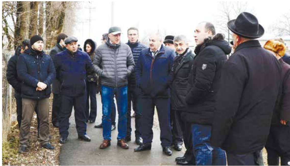
Встреча с руководством и активом аула Эльбурган.