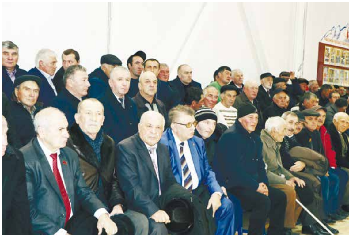
Праздник в Красном Востоке собрал гостей со всей республики.