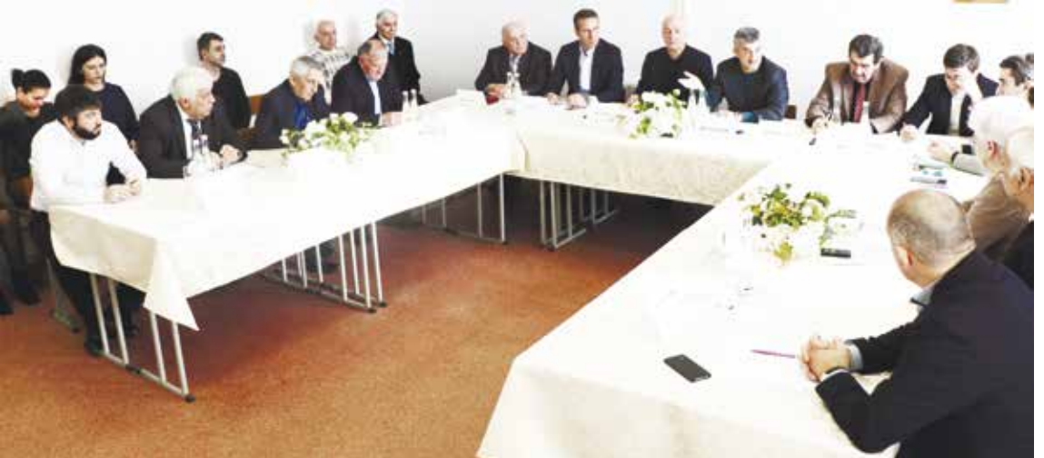
В ходе общения с руководителями абазинских общественных организаций абхазская делегация получила обширную и полезную информацию.