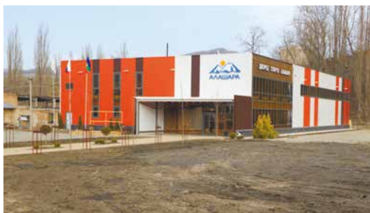
Дворец спорта «Алашара».

12 февраля в Красном Востоке в торжественной обстановке был открыт Дворец спорта «Алашара».