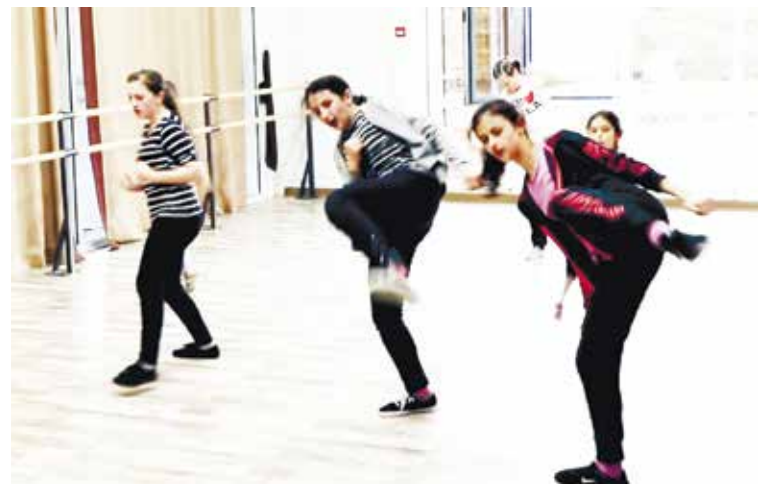
Каратэ в Красном Востоке - женский вид спорта.